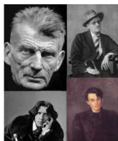
Beckett, Joyce, Wilde, Yeats