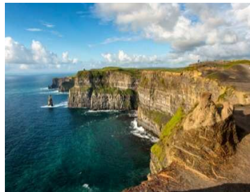
Cliffs of Moher