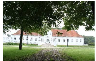
St. Restrup Slotshotel