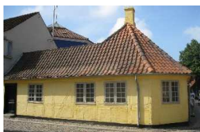
HC Andersens hus