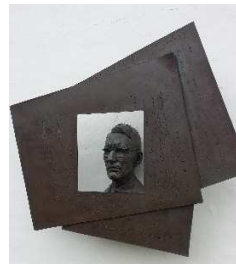
Johs. V. Jensen