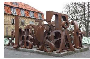
Dan Turell monumentet