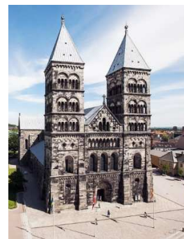
Domkyrkan i Lund