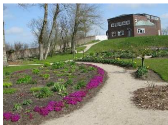
Emil Nolde Museum