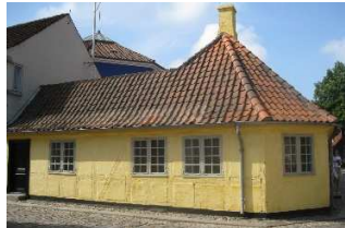
HC Andersens Hus