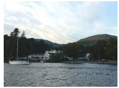
Wateredge Inn, Ambleside