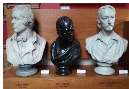
De tre store