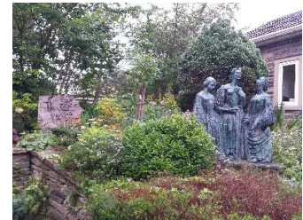
Tre søstre og en bror