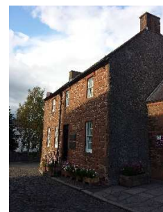
Robert Burns House, Dumfries