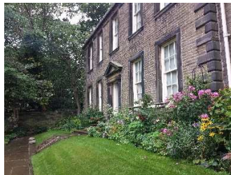
Brontë Parsonage Museum