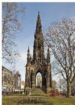
Scotts Monument Edinburgh