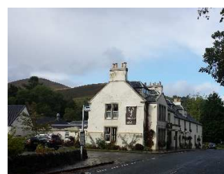
Loch Lomond Arms