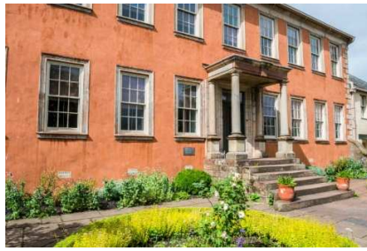
Wordsworth House Cockermouth