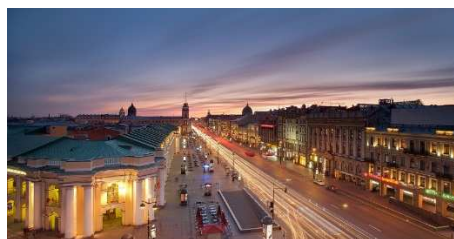
Utsikt fra Biblioteka

Pris: kr. 18.900,- pr. person i dobbeltrom (enkeltrumstillegg kr. 2.400,-)