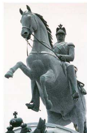
Zar Nikolai I