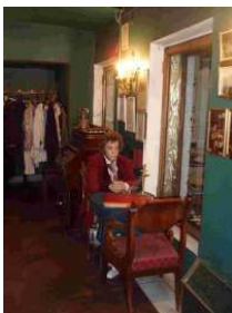
Entreen Literaturnoje Café