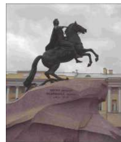
Bronserytteren (Peter den Store)