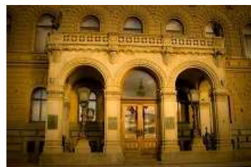
Fra Storhertug Vladimirs palass