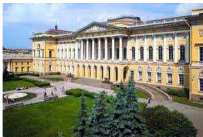
Det Russiske Kunstmuseum

Retur til hotellet etter forestillingen med buss, eller på egen hånd – det er ca. halvannen kilometer.