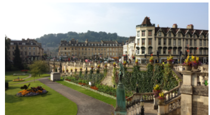
The Abbey Hotel