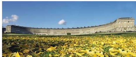
The Royal Crescent, Bath