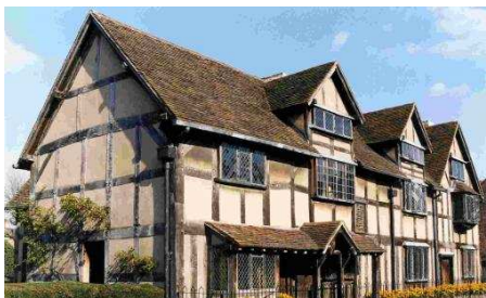
William Shakespeares fødested

Vi møtes kl.17 til middag på RSC Roof Top Restaurant i Royal Shakespeare Theater . Kl. 19.30 begynner kveldens drama, fremført i The Swan Theatre av verdensberømte Royal Shakespeare Company . Stykket er The Jew of Malta skrevet av William Shakespeares samtidige Christopher Marlowe. Selv om det ikke er Shakespeare som har skrevet stykket, garanteres en stor teateropplevelse.