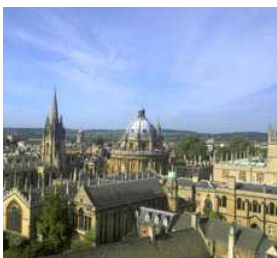
The City of Dreaming Spires

Spaserturen avslutter vi ved vår restaurant i Oxford sentrum der vi skal ha middag før dagens program er over.