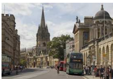
Oxford High Street