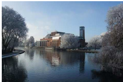
Royal Shakespeare Theatre