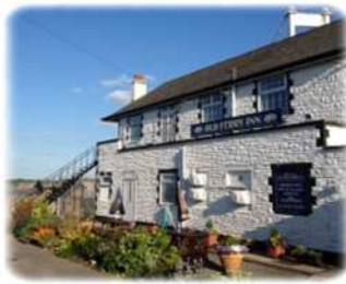
The Old Ferry Inn