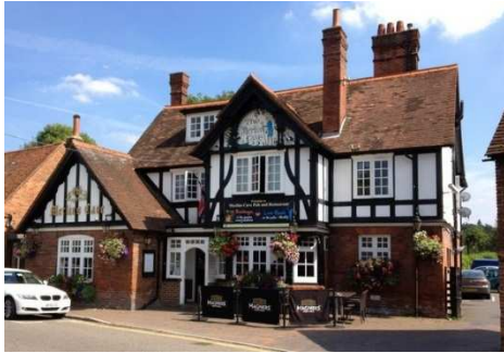
The Merlins Cave

Lunsjen får vi i restauranten The Merlins Cave , før vi fortsetter til Heathrow med flyavgang 15.35. Vi vil lande på Gardermoen kl. 18.45 norsk tid.