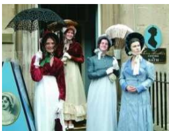
Jane Austen's Bath

Etter lunsj tar vi til Tintern Abbey , udødeliggjort ikke minst av William Wordsworth. Sist på ettermiddagen kommer vi frem til Cardiff, der vi først skal søke litt etter «norske» Roalds Dahls spor i byen, før vi sjekker inn og får middag på vårt hotell for de neste to netter.