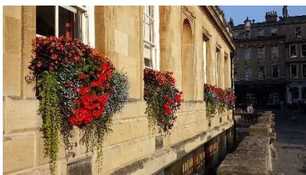
Parti fra Bath