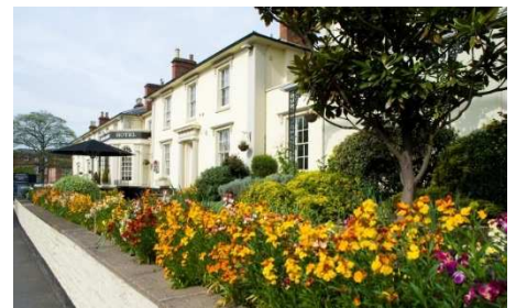
Hotel Grosvenor, Stratford-upon-Avon