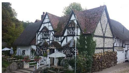
Restaurant White Horse