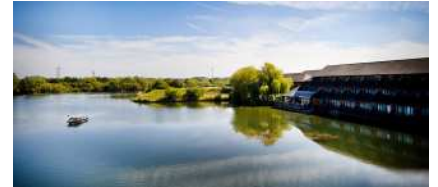
Reading Lake Hotel