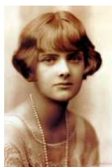
Daphne Du Maurier