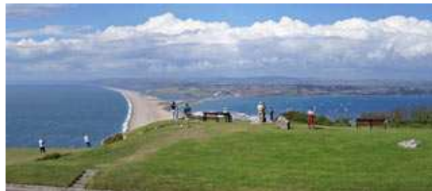
Utsikt over Chesil Beach