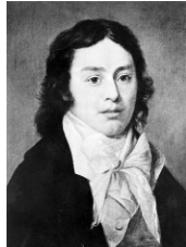
Samuel T. Coleridge